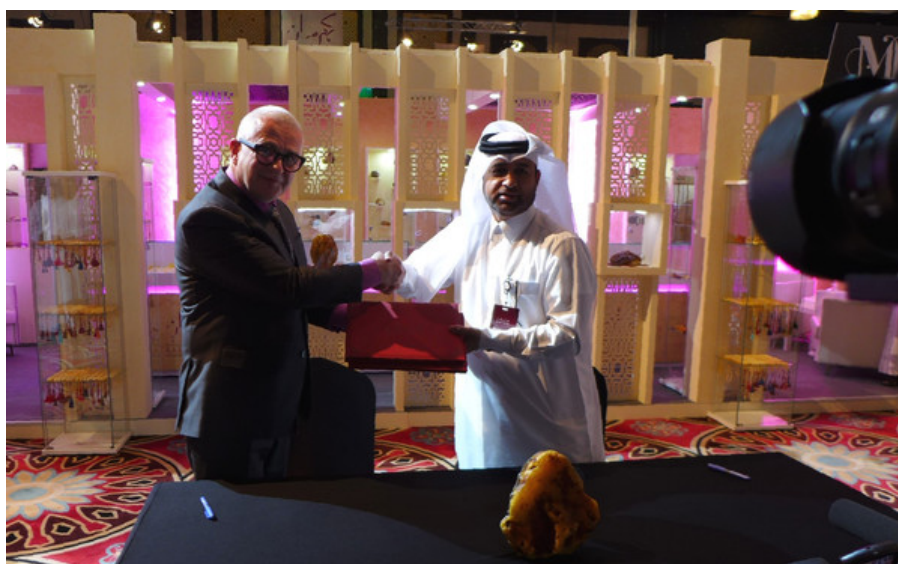
Fot.: Podpisanie listu intencyjnego.

Partnerzy listu deklarują wymianę doświadczeń, materiałów oraz udział specjalistów, a także współpracę na polu edukacji, publikacji i promocji kultury związanej z bursztyнем, jego historią oraz współczesnym wzornictwem. Kolejne działania oraz dalsze umowy mają wzmocnić rynek kolekcjonerski oraz pomóc w badaniu i certyfikacji w ośrodku w Katarze z wykorzystaniem know-how i doświadczenia Gdańskiego Laboratorium Bursztynu założonego przez MSB.