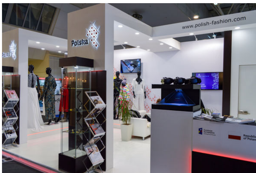
Polskie stoisko narodowe na targach CPM MOSKWA

Wystawcy podzieleni zostali na 15 hal tematycznych oraz pawilonów narodowych, w tym: kolekcji Premium, dziecięcych, akcesoriów oraz obuwia czy też bielizny i kolekcji plażowych. Wydarzeniu towarzyszyło wiele dodatkowych atrakcji, w tym pokazy mody na profesjonalnie przygotowanym wybiegu oraz seminaria. 4 dni intensywnych spotkań oraz rozmów biznesowych relacjonowanych było przez ponad 300 rosyjskich i międzynarodowych dziennikarzy oraz przedstawicieli mediów.