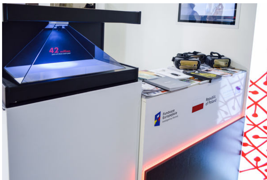
Materiały audiowizualne oraz promocyjne od polskich przedsiębiorców