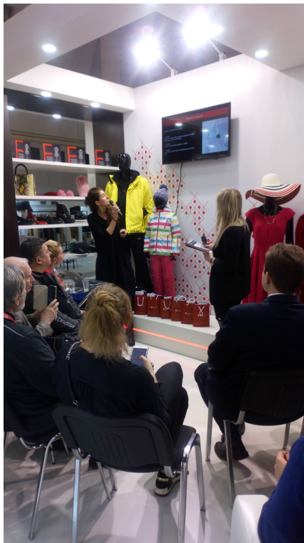
Konferencja prasowa z udziałem mediów oraz przedstawicieli polskich firm