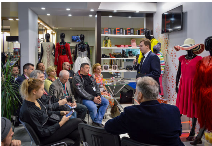
Konferencja prasowa z udziałem przedstawicieli ZBH w Moskwie

W czasie targów odwiedzono polskich przedsiębiorców, przeprowadzono rozmowy z przedsiębiorcami na polskim stoisku, a także miały miejsce wywiady oraz rozmowy z dziennikarzami polskimi, lokalnymi i międzynarodowymi.